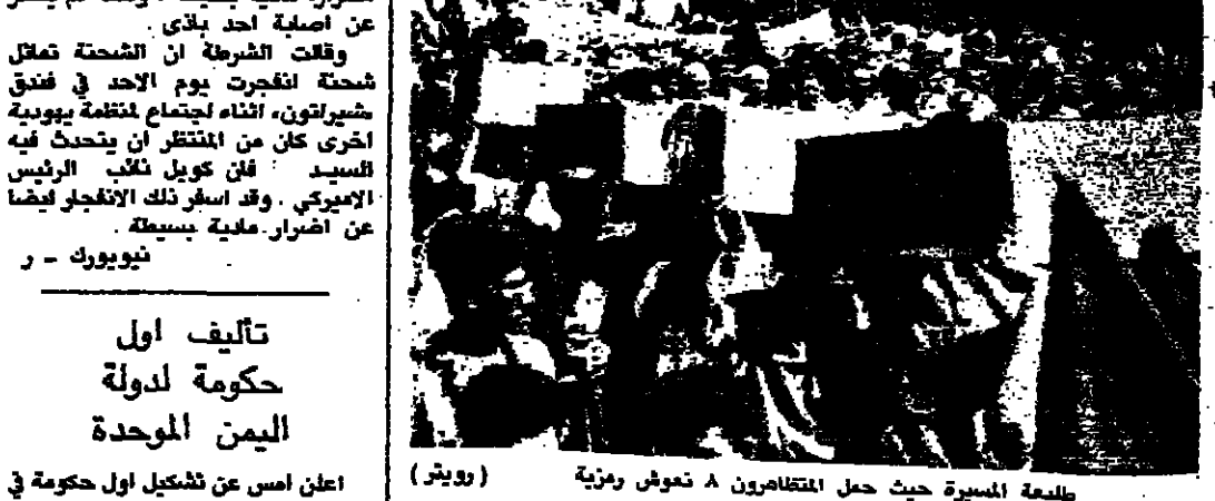
طلبة المسيرة حيث حمل المتظاهرون ٨ نعوش رمزية

اشترك الاف من الفلسطينيين امس الاول في مسيرة داخل مخيم البيريك للاجئين الفلسطينيين قرب دمشق احتجاجا على المجزرة التي تعرض لها الفلسطينيون قرب تل ابيب وفي الضفة الغربية وقطاع غزة المحتلين ودعا الازن للعلم للامم المتحدة ان توفّر الحماية للفلسطينيين الخاضعين للاحتلال الاسرائيلي. وتقدم المسيرة قادة الفصائل الفلسطينية المتواجدين في سوريا ولعمامة نعوش رمزية للعمال الفلسطينيين الذين قتلوا يوم الاحد الماضي على يد مسلح اسرائيلي. وحمل مئات من الاطفال الفلسطينيين نعوشا رمزية من الحجر والخرق والحقائب والسكاكين الحادة وهم يرددون هتافات تنهد بالقرار لدماء الشهداء الفلسطينيين. ورفعت عشرات من اللافتات في الخلف جاء في بعضها - لا لاستسلام ولا للتفاوض او الاعتراف بالعدو الصهيوني الف نجم للضاح الفلسطيني المسلح. الادارة الاميركية حليف قوي للصهيونية اليمينية. (البقية على الصفحة ٩)